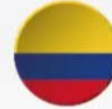
Tabla de bonos